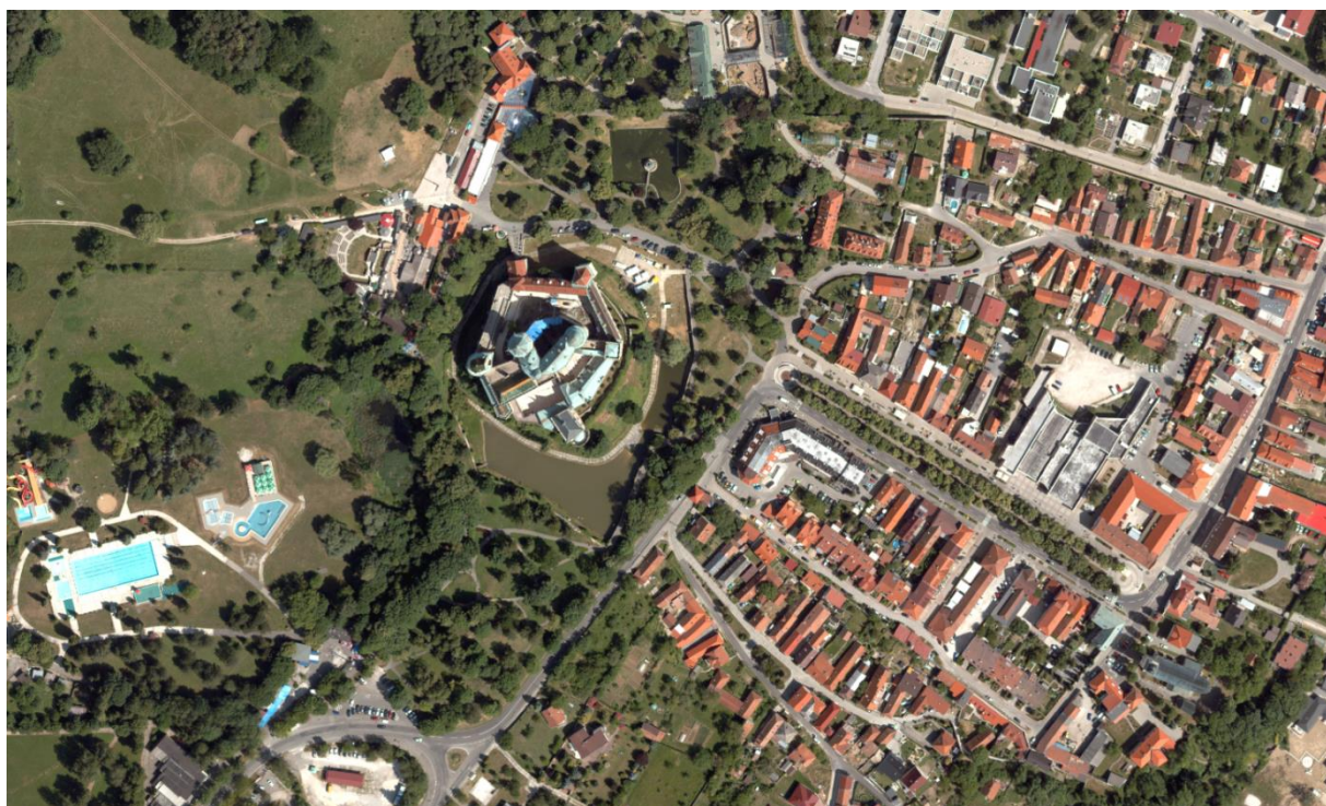
Obr. 2 Ukážka ortofotomozaiky – Bojnický zámok