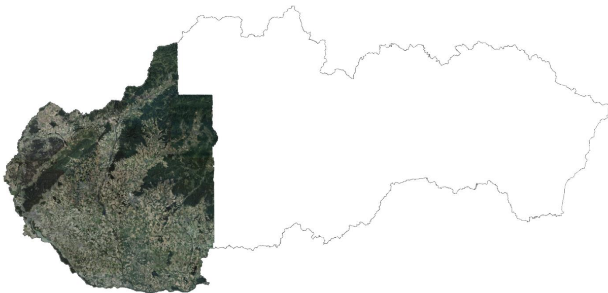
Obr. 1 Rozsah leteckého meračského snímkovania v roku 2017

V roku 2018 bude snímkovanie pokračovať v lokalite stredného Slovenska (obr. 3).